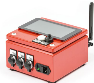
Gehring Connection Box

Vertrauen auch Sie auf den Technologieführer mit seiner jahrelangen Erfahrung und globalen Präsenz! Innovative Technologien kombiniert mit wirtschaftlicher Denkweise zeichnen uns aus.