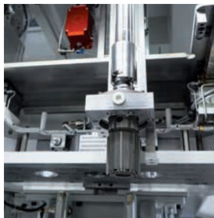
支持在线气动测量的PT珩磨刀具

快速高效的换刀系统是整个灵活多样的加工工艺的一个重要前提条件。流程工艺上要求的刀具更换以及必要的工件换型都能在最短时间内可靠地完成。PT系列使用的刀具系统亦会被配套使用并充分发挥其优势。由配备气检装置的刀具和格林气电转换仪所组成的在线气动测量系统，即使在砂条补偿量很大的情况下也能保持高的精度。