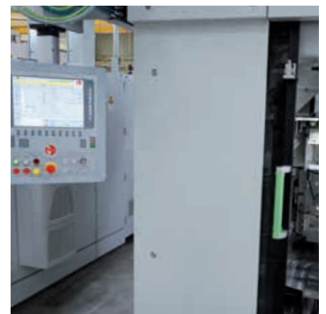
移动操作面板实现工位一览化

格林珩磨机的每个工位格林移动式操作面板GOP上都能实现一览无余。友好的界面显示以及一目了然的界面设计使整个程序的应用和操作都简单方便。通过电子机械式的进给单元可以实现高标准尺寸精度控制和形状公差优化。各根主轴在各自的维护范围内都能良好直观的进行调试。结合设置在机床内的维护空间使每次机床的维护保养都能安全便捷。