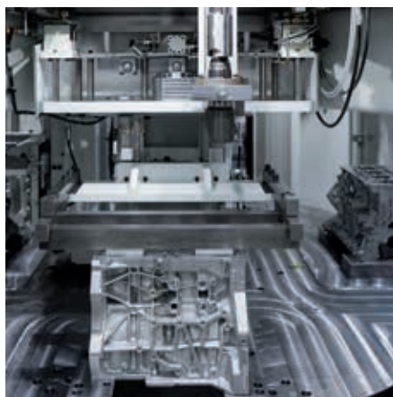
三工位加工的转台

新研发的PT-Z系列珩磨机结合了已知的Z系列和PT系列的优势。运用格林模块加工理念使整个珩磨加工在一个模块单元中完成变成可能。无论是三缸或四缸工件都可依靠三加工工位的模式上同时实现高效珩磨加工，并提升加工节拍。增加的机床转台可以提高工件在每个工位传输时的速度，从而达到缩短整个加工节拍。无论是配置桁架机械手，滚道还是其他上下料方式，整个加工工序都可以高效灵活的完成。